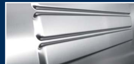
Seitenwände für Hygieneschrank