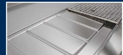
Tiefgezogene Mulde mit abgerundeten Ecken